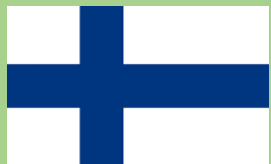
fēn lán 芬兰

Harjoittele kiinan kirjoitusmerkit vahvistamalla!