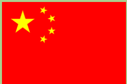
zhōng guó 中国