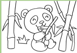
xióng māo 熊猫