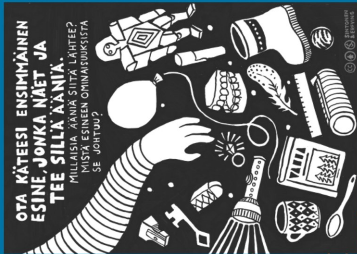
Herkkien korvien tehtäväkortit 2 - Sintonen & Erving

Kokeilkaa tehdä erilaisia ääniä ja äänittääkää niitä tabletilla.